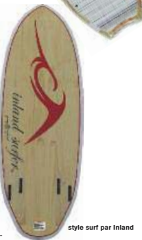
style surf par Inland