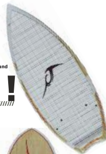
Style skim par Inland

Wakesurfers differentiate between two styles: Skim: the skim board is relatively thin (1.5 to 2.5 cm) and around 1.20 or 1.50 m long, ideal for fans of fancy moves (style skate, rotations, shuvit...) Surf: the wakesurf board is thicker (between 3 and 5 cm) and longer (1.40 to 2 metres), more like a classic surf board. Wakesurfers are looking to recreate the sensation