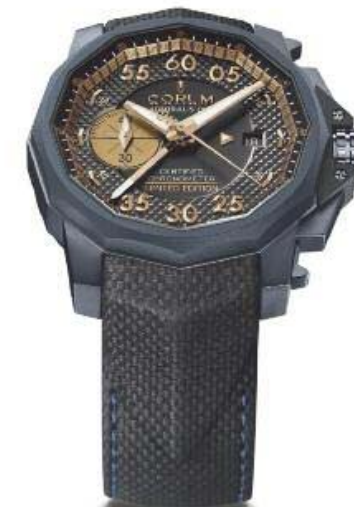
ADMIRAL'S CUP BOL D'OR 2011 LIMITED EDITION